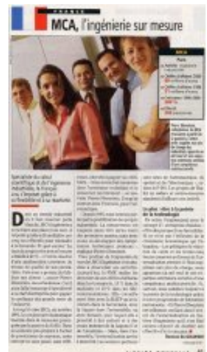
Voir la revue de presse Septembre 2001

Avec un taux de croissance à deux chiffres, MCA Ingénierie s'offre ainsi la 305 ème place au classement au niveau européen et la 32 ème place au niveau français.